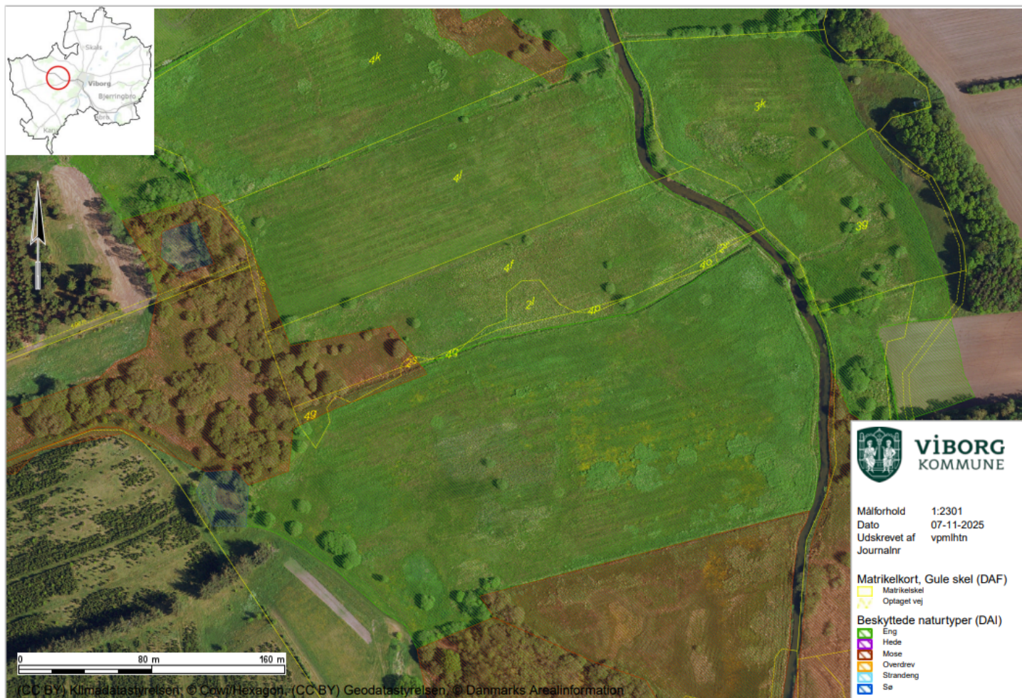
Figur 2: Oversigtskort med angivelse af beskyttede arealer efter Naturbeskyttelsesloven. Grønne skraverede områder er beskyttede enge og brune skraverede områder er beskyttede moser. Beskyttede søer er skraveret med blå.