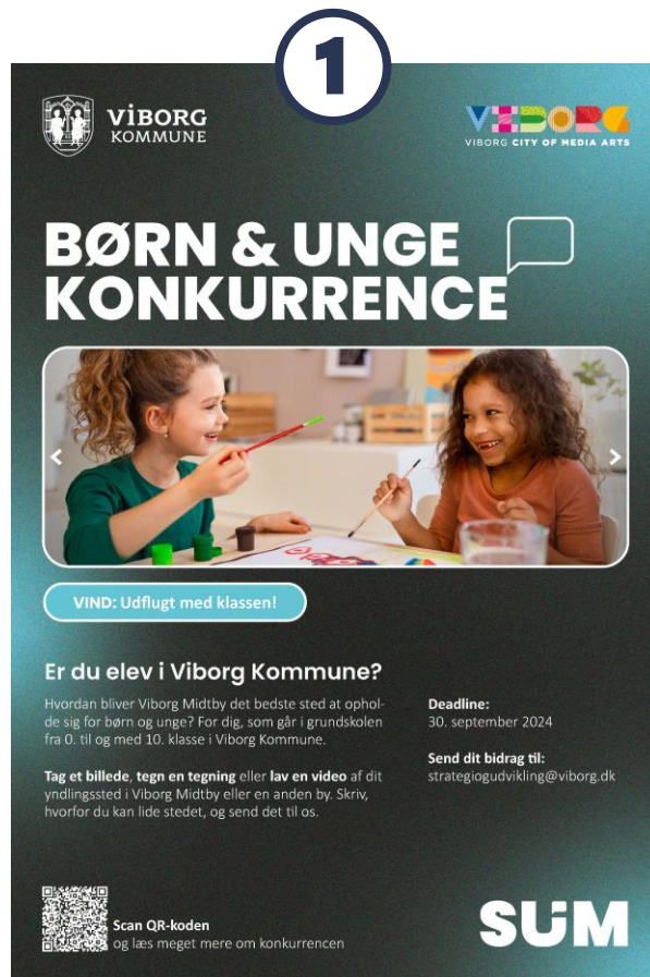
Konkurrence #1: Børn og unge i grundskolen

Alle konkurrencer løber helt til d. 30. september