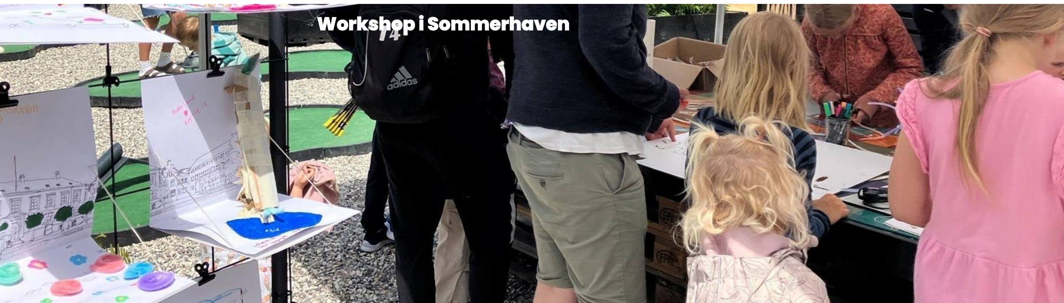
Workshop i Sommerhaven