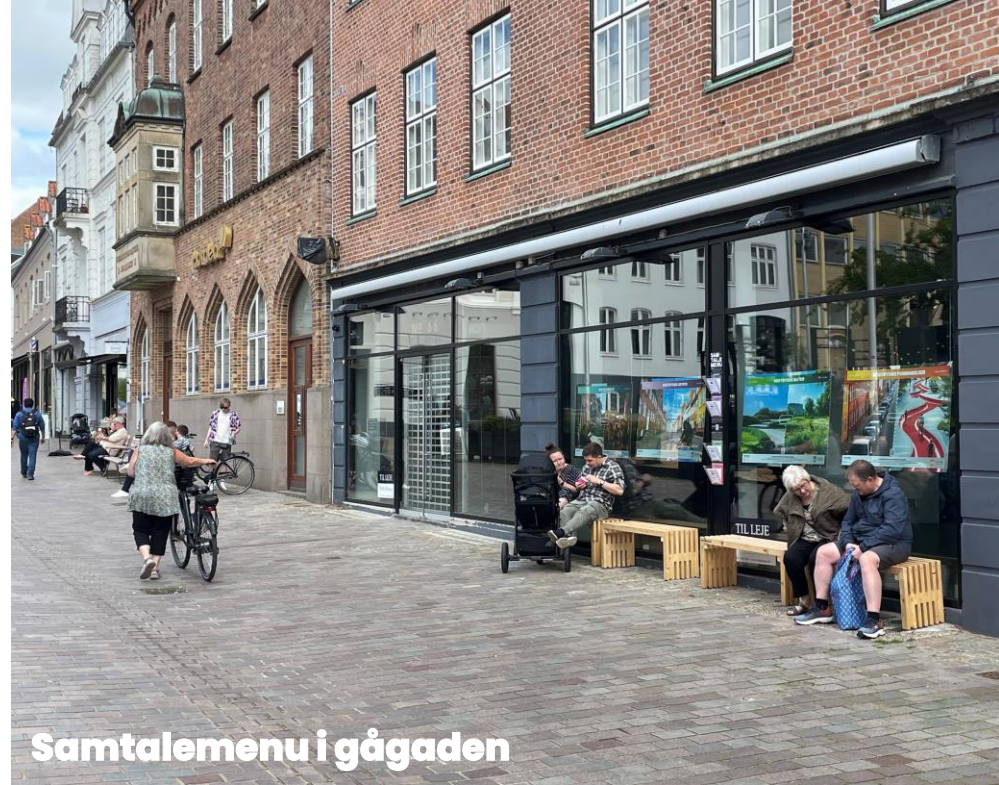
Samtalemenu i gågaden