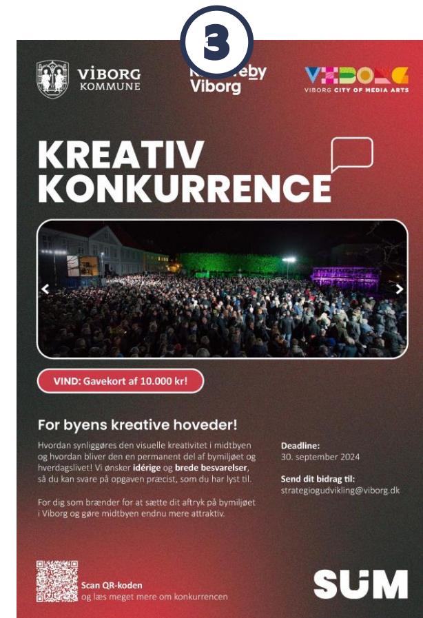
Konkurrence #3: Alle byens kreative hoveder