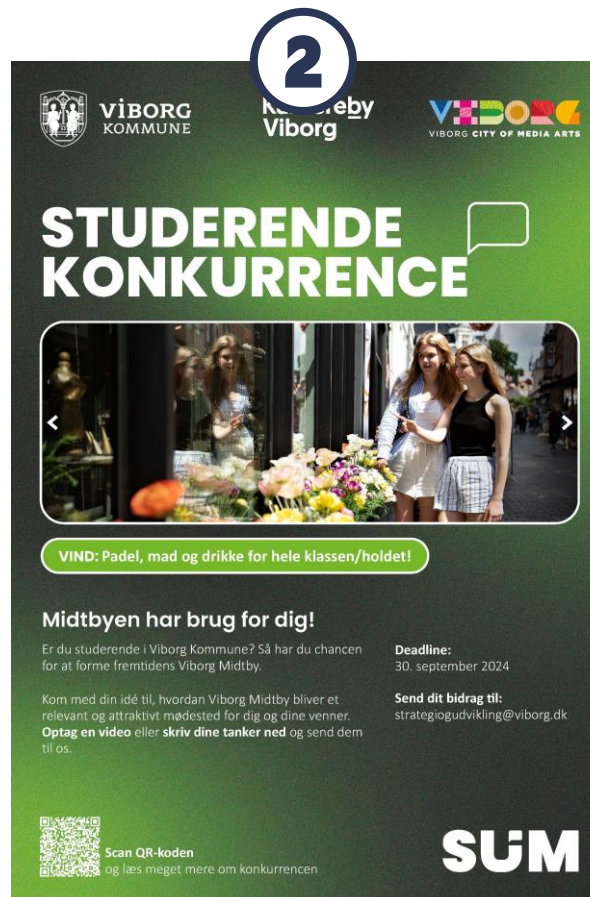
Konkurrence #2: Ungdoms- og videregående uddannelser