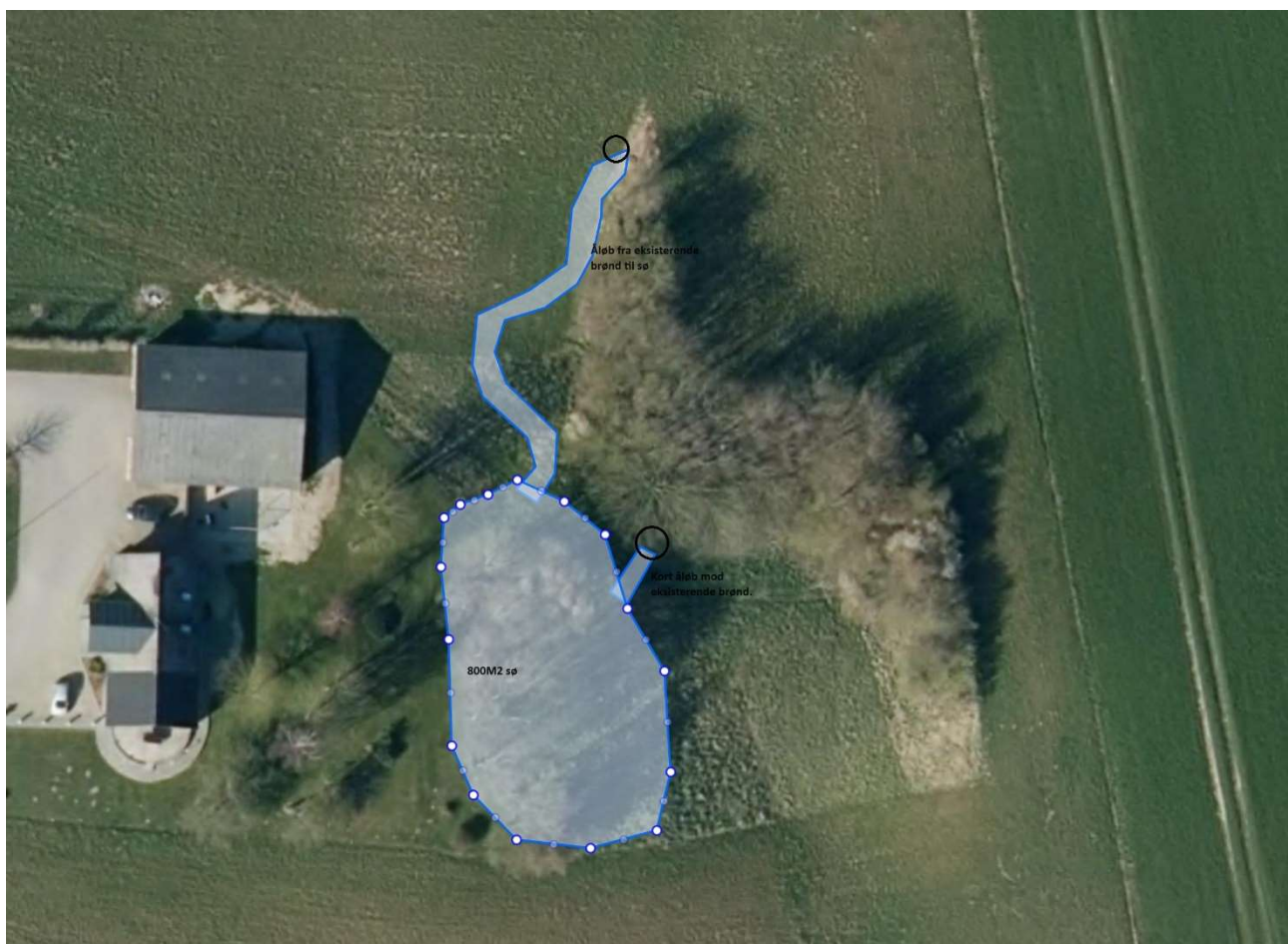
Figur 3. Detailtegning for sø. Sorte cirkler angiver placering af eksisterende brønde.